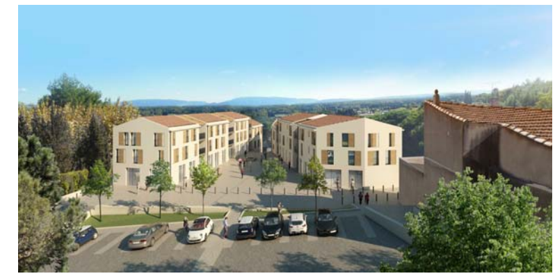
PLACE DE LA POSTE